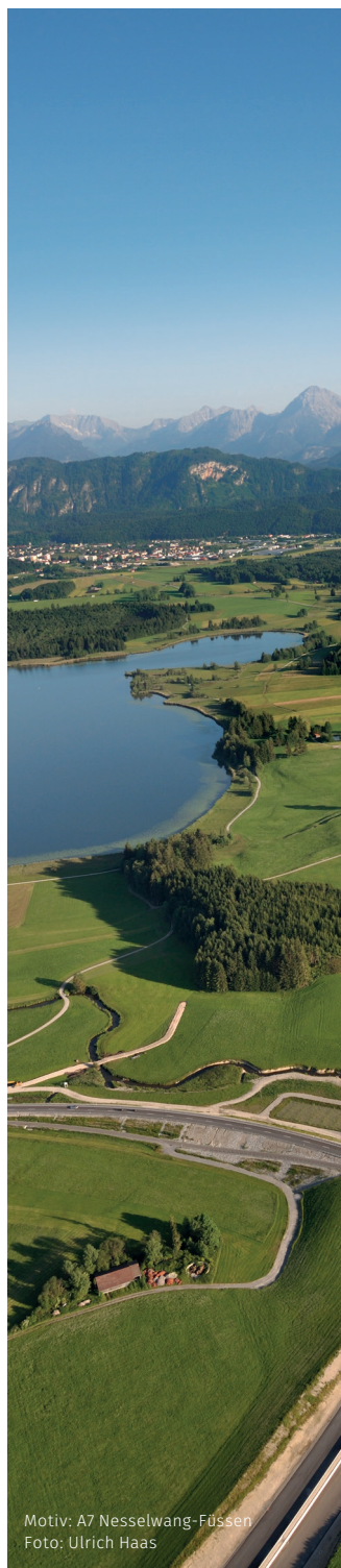
Motiv: A7 Nesselwang-Füssen